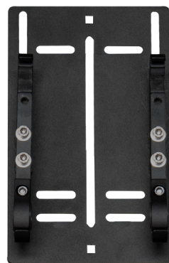
Plaque avec pièces d'accroche