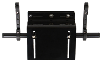
Fixation appui tête