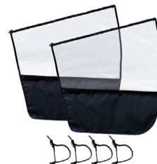
Protections latérales avec fixation accoudoirs