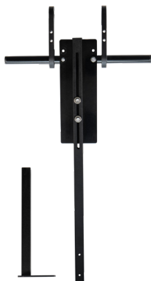
Fixation tube carré sous le siège