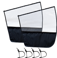
Seitenschutz mit Armlehnenbefestigung