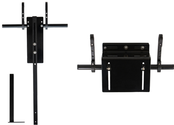
Sitz viereckige Rohrbefestigung